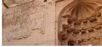
Fotoğraf 3. a Hångâhı Kitabesi http://www.tishineh.com/touritem , 25.01.2017