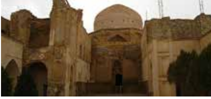
Fotoğraf 2 b Külliye avlusu