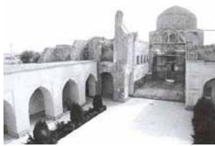
Fotoğraf 2 a Sultaniye Külliye Avlu Yönünde Türbenin karar yeri, Hângâh ve Aramgâh-ı Çelebioğlu, s.23